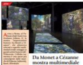
Da Monet a Cézanne mostra multimediale