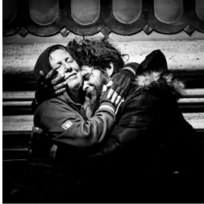
Una volontaria con un clochard

Due bambini che attraversano la Porta Santa della basilica di Santa Maria Maggiore con le manine appoggiate sui bassorilievi delle ante per una breve preghiera, ma forse anche per riposarsi un po'. Un clochard appoggiato alla base di una colonna di piazza San Pietro viene rifocillato da una volontaria che riesce a strappargli un sorriso mentre mangia un panino. Profughi e immigrati assistiti in uno dei tanti centri di accoglienza di Roma. Volontari che accompagnano gruppi di