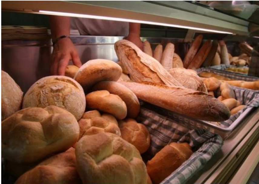
Acli Roma ha raccolto 30 tonnellate di pane in un anno per i meno abbienti

ROMA - Sabato prossimo alle 16, presso la Pelanda Factory, in piazza Orazio Giustiniani, si terrà lo spettacolo « Il Pane a Chi Serve, la bellezza della concretezza ». L'appuntamento ha l'obiettivo di presentare i risultati e rilanciare il progetto « il Pane a Chi Serve » e sensibilizzare i cittadini sul tema del recupero alimentare. L'evento fa parte del ciclo di appuntamenti della I edizione dell'« Ottobrata Solidale », un percorso di avvicinamento al Giubileo della Misericordia ed è promosso dalle ACLI di Roma, la Federazione Anziani e Pensionati di Roma e dall'Unione Sportiva ACLI di Roma con la collaborazione del Sistema Acli, Associazione Hope e con il patrocinio della Regione Lazio, Roma Città Metropolitana, Roma Capitale, la Polizia di Stato, Expo 2015 e il Vicariato di Roma.