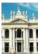
Basilica A.S. Giovanni messa e folklore

■ «Domenica 18 maggio, a San Giovanni in Laterano, si svolgerà la XXIII edizione della Festa dei Popoli intitolata "Una ricchezza da accogliere". L'evento, che celebra l'importanza ecclesiale e sociale della presenza delle comunità migranti nella diocesi e nella città di Roma, è organizzato dai Missionari Scalabriniani, dall'Ufficio Migrantes di Roma e dalla Caritas diocesana con le comunità etniche di Roma e provincia, le Acli provinciali , Roma